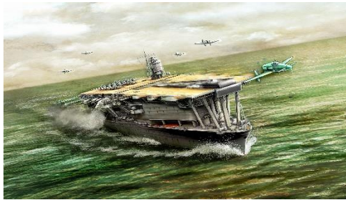
右：イメージイラスト