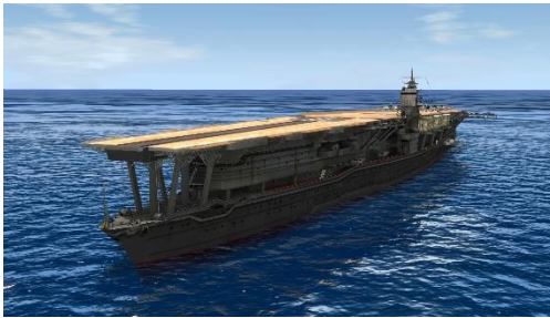
空母「赤城(対ゴジラ兵装)」 左：3D モデルスクリーンショット