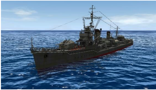
駆逐「雪風(対ゴジラ兵装)」 左：3D モデルスクリーンショット