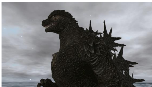
右：ゴジラスクリーンショット