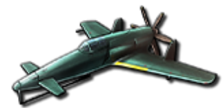
コラボパーツ 「★5 J7W1 震電」

また、対ゴジラを想定した兵装を搭載させたコラボ艦艇「雪風(対ゴジラ兵装)」「赤城(対ゴジラ兵装)」が新たに参戦します。雪風(対ゴジラ兵装)はサルベージ、赤城(対ゴジラ兵装)は総力戦にて獲得ができます。