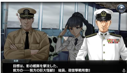
イベント「総力戦」 左：スキットスクリーンショット

また、同コラボ期間中で、所持している全ての艦艇を駆使し、敵の撃破を目指すイベント「総力戦」が開催されます。マップ内に配置されている各ステージの敵に勝利することで、総力戦ポイントが獲得でき、獲得したポイントを使用することで、コラボ限定アイテムをはじめとした様々な商品と交換できます。さらに、本イベントは、蒼焰艦隊がゴジラに挑む模様を描いたオリジナルシナリオ付きとなっています。