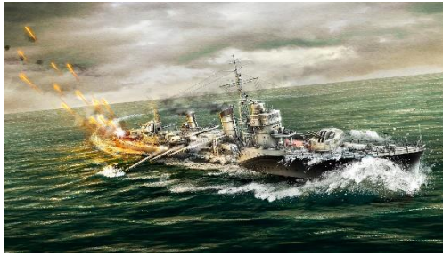
右：イメージイラスト